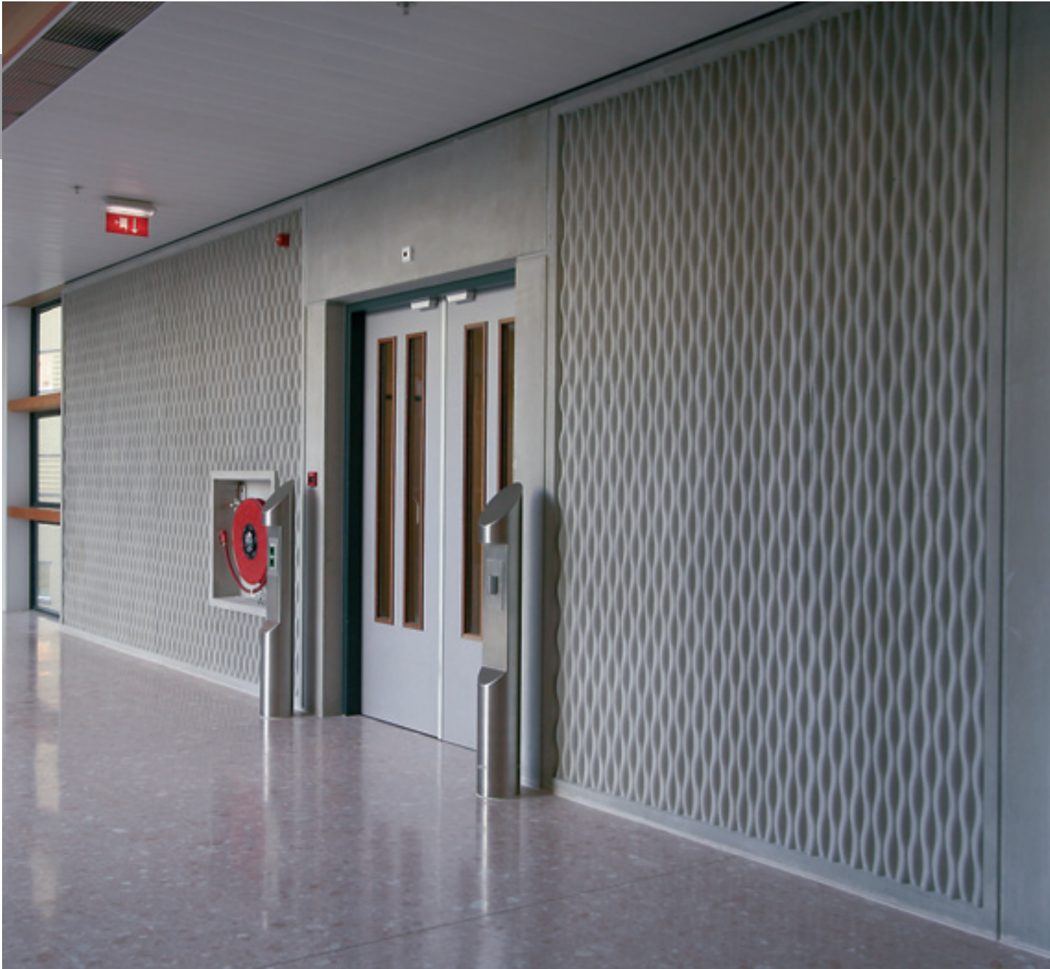
1/43 Corse (invers)