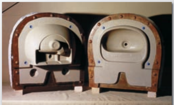
Sanitärkeramik - Waschbecken Sanitary ceramics - Wash hand basin Sanitaire - Lavabo