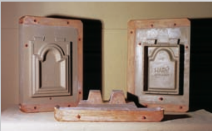
Ofenbau - Kachel Stove construction - Dutch tile Poêle en faïence