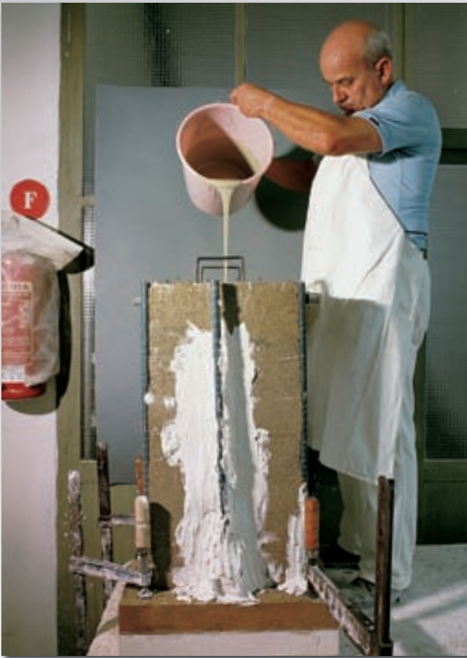
Guss eines Waschtischfußes Pouring a washing table leg Coulage d'un pied de lavabo