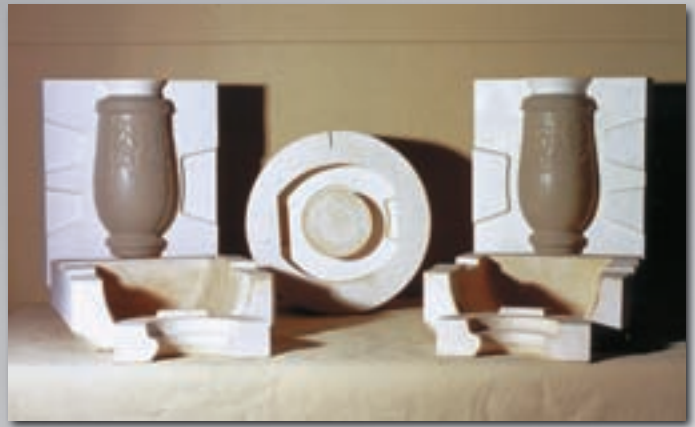
Porzellanindustrie - Vase Porcelain industry - Vase Industrie de la porcelaine - Vase

Exemples d'utilisation: réalisation de moules mère