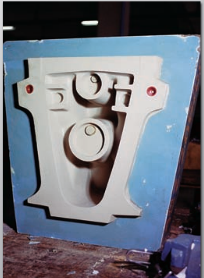
Klosett - Unterteil W.C. - lower section Cuvette de W.-C. - Partie inférieure