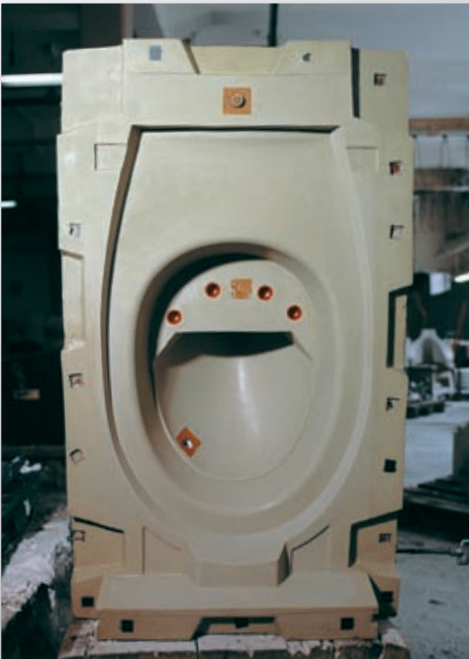
Klosett - Oberteil W.C. - upper section Cuvette de W.-C. - Partie supérieure