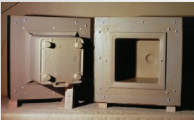
Sanitärkeramik - Laborbecken Sanitary ceramics - laboratory basin Sanitaire - lavabo de laboratoire