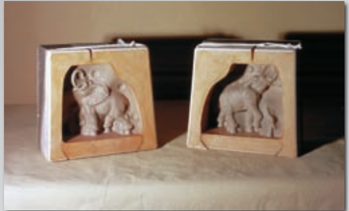
Zierkeramik - Elefant Decorative ceramics - Elephant Céramique d'ornementation - Eléphant