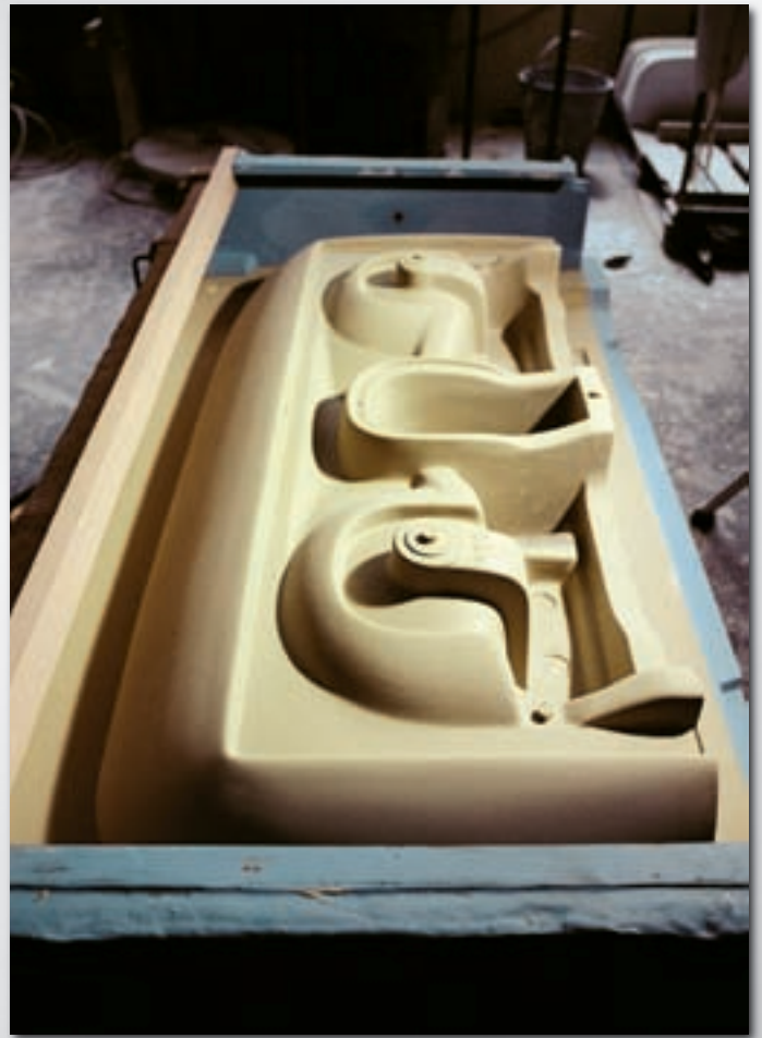
Doppelwaschbecken Double wash hand basin Evier double