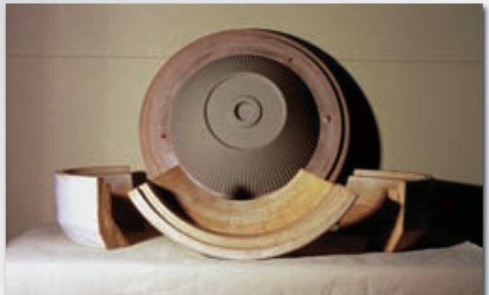
Gebrauchskeramik - Lampenschirm Utility ceramics - Lamp shade Objets usuels - Abat-jour